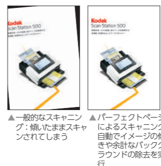
▲一般的なスキャニング：傾いたままスキャンされてしまう ▲パーフェクトページによるスキャニング：自動でイメージの傾きや余計なバックグラウンドの除去を実行