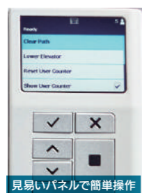
見やすいパネルで簡単操作