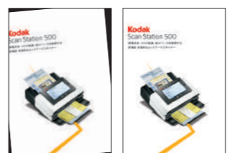
▲一般的なスキャニング：傾いたままスキャンされてしまう ▲パーフェクトページによるスキャニング：自動でイメージの傾きや余計なバックグラウンドの除去を実行